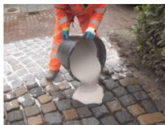
Uitgieten SP II op vochtige bestrating en met bezem in de voegen vegen