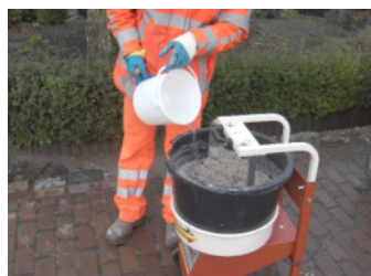
Toevoegen tot max 3 liter water (3-6 min mengen)