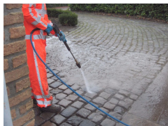
Schoonmaken bestrating en voegen